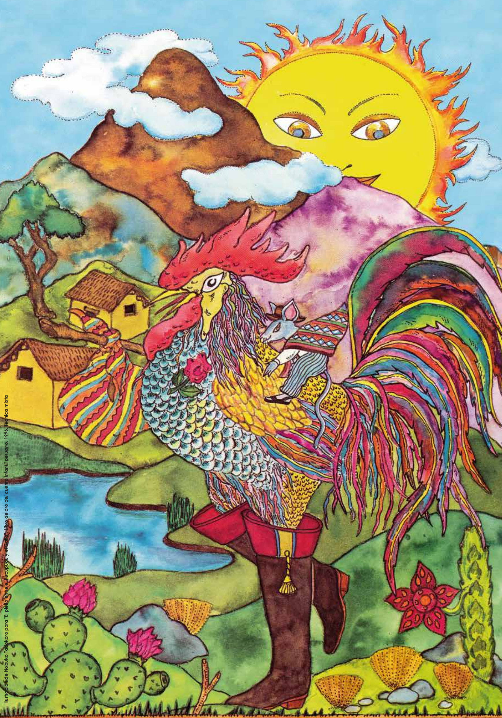
Ilustración de Nobuko Takakoro para "El pleto entre el Pacapaguay y el Gallo", libro de oro del cuento infantil peruano, 1996, técnica mixta