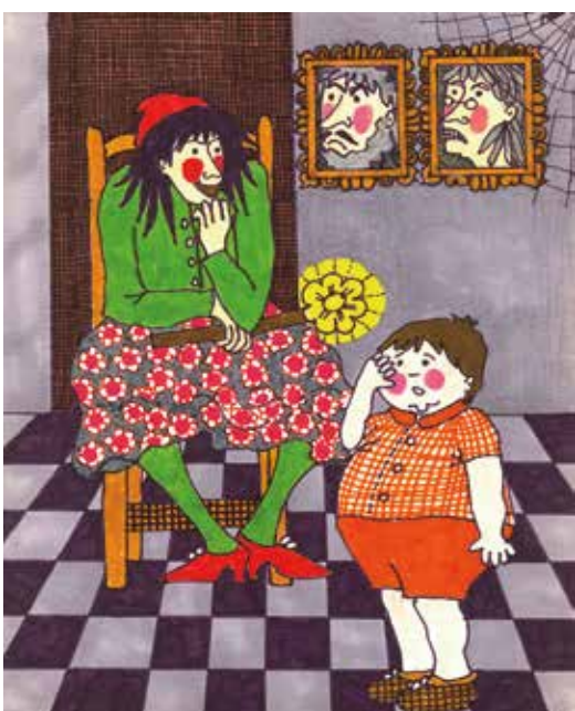
Rosario Núñez Bruja mentecata , inédito Técnica mixta