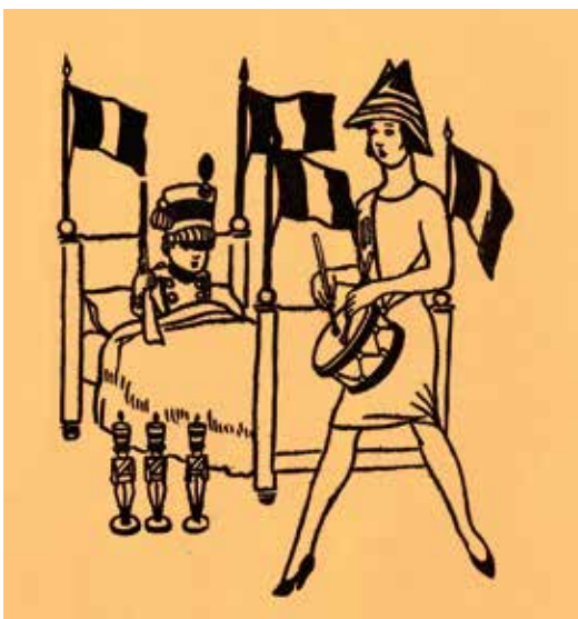
Jorge Vinatea Reinoso Juguetes , 1929 Tinta china sobre papel