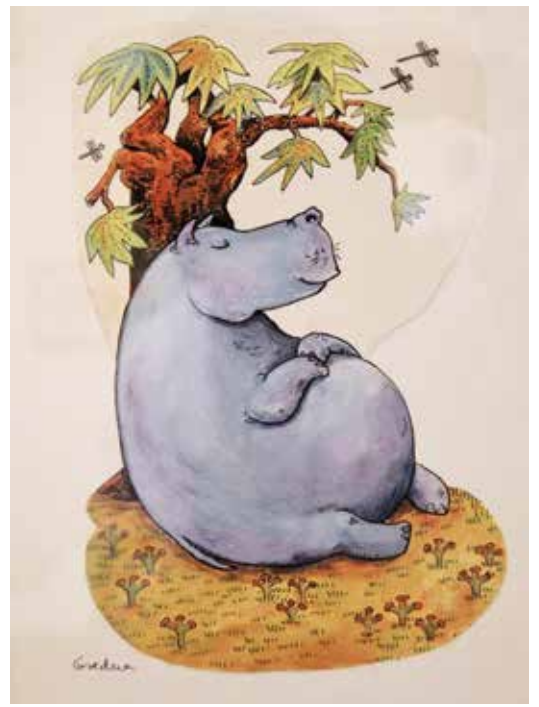
Gredna Landolt Reino animal , 1984 Tinta china y acuarela

Daniel Contreras / Carlos Maza Curadores