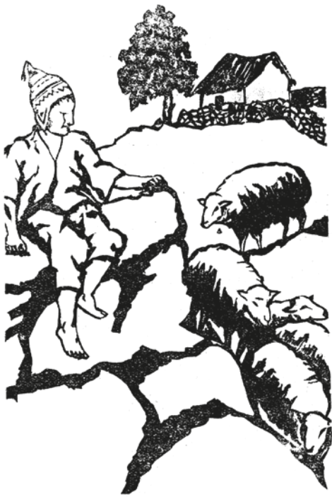
Mateo Jaika Niños del Kollao , 1937 Grabado