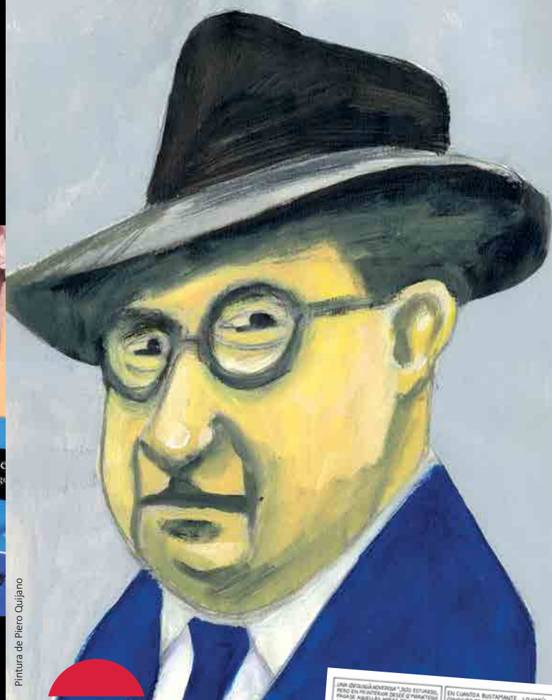
Pintura de Piero Quijano